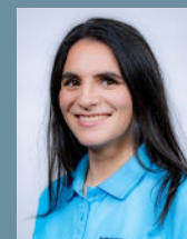
Gurbet Mal med. Fachangestellte