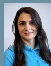
Adle Mal Praxisteam