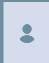
Ariane Schuld med. Fachangestellte IVOM-Team